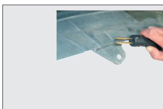
Волнистые скобы с крупной и мелкой змейкой 0.6 мм для ровных поверхностей на тонком пластике.

Подключение 220В, мощность 440Вт, масса 760гр, габариты 239x49x61мм.