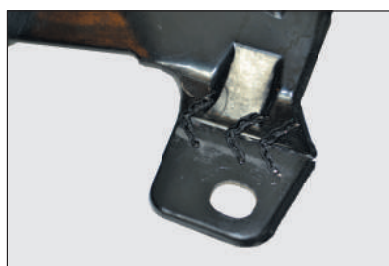
Волнистые скобы с крупной и мелкой змейкой 0.8 мм для ровных поверхностей, подверженных нагрузкам и вибрации.