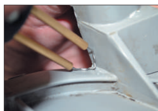
Скобы угловые 0.8 мм для ремонта внутренних и внешних углов крепёжных элементов.